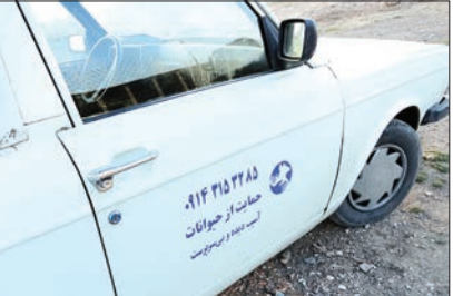
خودروی جمع آوری سگ‌ها از محیط شهری

دامپزشکان شما چه کسانی هستند؟ گرچه‌های معلول را نگهداری می‌کنم تا وقتی خوب شدند به حیوان دوستی واگذار کنیم. الان هم ۷ گربه در حیاط و پارکینگ خانه نگهداری می‌کنم تا خوب شوند.