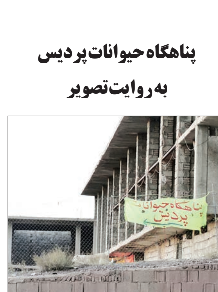
ساختمان‌سازی اطر این‌جا پناهگاه رنگ‌خطر اخراج حیوان‌هاست