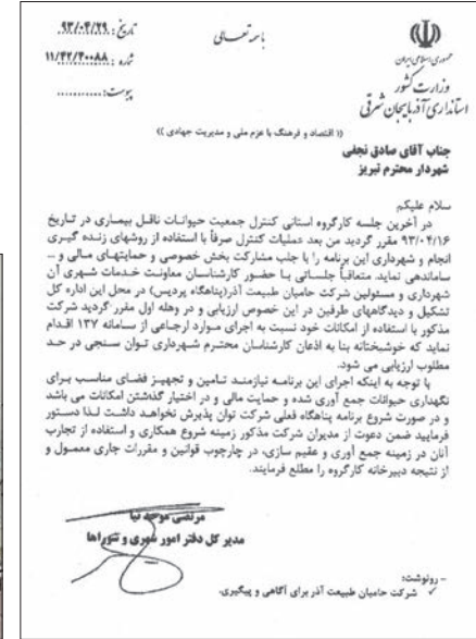
موضوع زنده‌گیری سگ‌های بی‌پناه که ۲۹ تیر ابلاغ شد