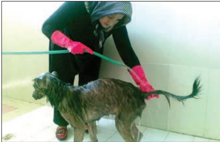
هر هفته یک‌روز حیوان‌ها شست‌شو داده می‌شوند