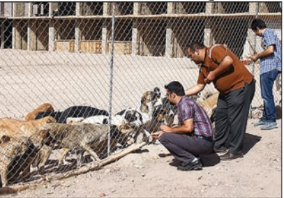
بازدید مردم از پناهگاه و دادن غذا به سگ‌ها