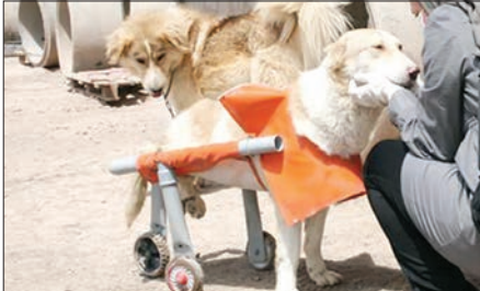
ساخت ویلچر برای سگ معلول در ایران