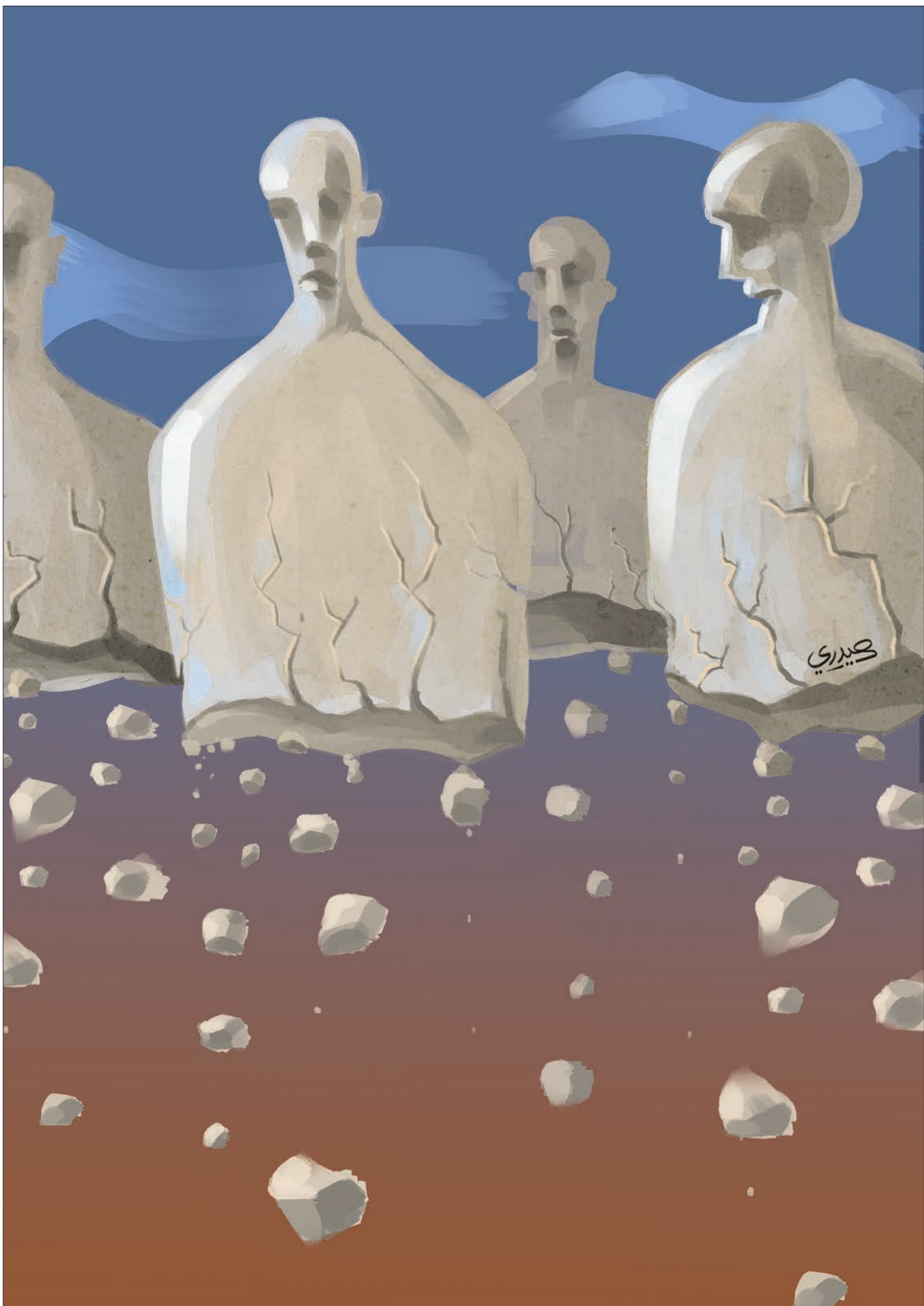
طرح: هادی جمیری / شهرزاد