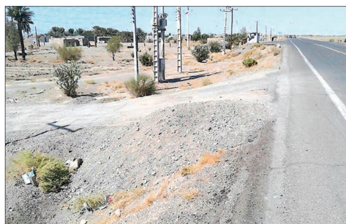
تصویری از محل حادثه