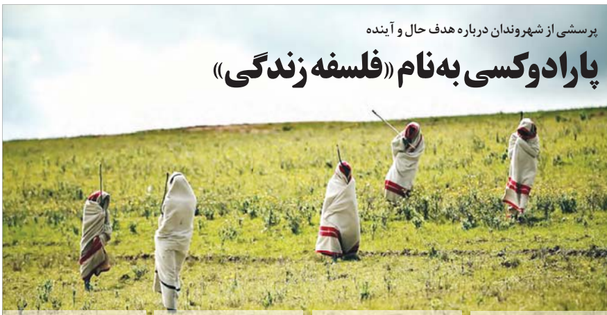
برخی شهروندان پرسیدم محصول پریشی و باسختی را به زیر بار طبع آرناسیامه، یعنی تحمل و خواندن این سطور شده‌ام. ما را به این فکر فرود که «فلسفه زندگی» همان چیست؟ دنبال چمی کردیم؟