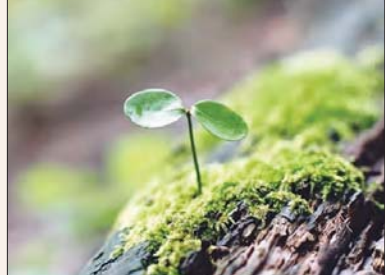
عشق که باید جزو تکلیف سلول‌های بدن باشد جزئی از خود شود.

دانشجوی‌های زیادی می‌شود به نظر من این نکته مهم را جامعه امروز ما باید مورد توجه قرار دهد که کسب درآمد خوب است اما نباید به هدف تبدیل شود. درآمد بیشتر می‌تواند وسیله باشد برای رفع نیازها و رسیدن به آرامش، آسایش و رفاه اقتصادی و پر خوراری زندگی راحت‌تر، اما کسب درآمد امروز در جامعه ما وسیله نیست بلکه هدفی است که بسیاری از افراد و اخلاقیات به واسطه آن زیر پا گذاشته می‌شود. اگر قرار است هدف وسیله را بپوشاند باید گفت که امروز همان کسب درآمد وسیله را بپوشاند یعنی کسب درآمد از راه‌های نامعقول، سبزه زاری، فساد و غیره. هدف اصلی ما باید رسیدن به تعالی و رشد و تعالی است. در ۲۰ سال بعد معنوی و مادی از طریق حضور و نقش آفرینی مثبت در جامعه است. تقریباً بیشتر انسان‌ها به ویژه اکثریت مردم ایران دنبال دستپاچی به این هدف هستند. افراد در طول زندگی برای رسیدن به اهداف خود روش‌های مختلفی را انتخاب و امتحان می‌کنند، اما هدف‌های کلی انسان همان رسیدن به تعالی معنوی و مادی است. حال ممکن است که برخی افراد، هدف‌های معنوی را بر اهداف مادی ترجیح داده یا برعکس و ممکن است افرادی باشند که تنها به مادی بودن زندگی خود توجه داشته باشند. در زندگی ما دو نوع هدف داریم: هدف مادی و هدف معنوی. هدف مادی به این معناست که ما برای رسیدن به آن نیاز به تلاش و کوشش داریم. هدف معنوی به این معناست که ما برای رسیدن به آن نیاز به تلاش و کوشش داریم. هدف مادی به این معناست که ما برای رسیدن به آن نیاز به تلاش و کوشش داریم. هدف معنوی به این معناست که ما برای رسیدن به آن نیاز به تلاش و کوشش داریم.