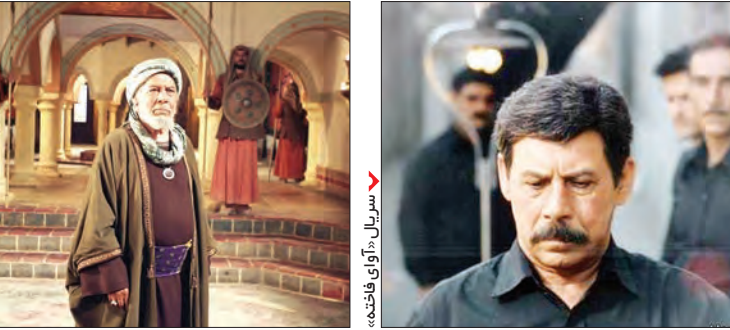
سرپال «هفتاد و نه»