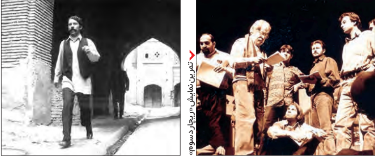
فیلم سینمایی «فرار از تله»