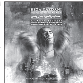
رضا یزدانی و تنظیم بهروز پایگان این قطعه قابلیت پخش آنلاین دارد که در صورت تمایل می توانید آن را دانلود کنید. اما درباره رضا یزدانی باید گفت نیازی به معرفی ندارد. او متولد ۱۳۵۲ است که از نوجوانی موسیقی را پی گرفته و آثار معروفی هم در تیتراژ فیلم های سینمایی و هم به صورت آلبوم ارائه داده است.

پایان سال گذشته همراه بود با انتشار تک آهنگ رضا یزدانی به نام «هارونی». این قطعه در واقع قطعه ای بود که به شکل عیدانه به علاقه مندان تقدیم شده بود. ترانه کار، شعری بود از پدیده نیشابوری یا هنگساز