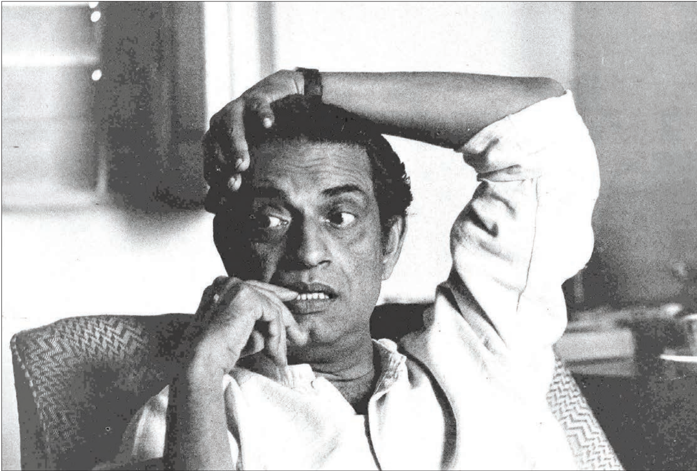
۲۵ سال پیش، برابر با بیست و سوم آوریل ۱۹۹۲ میلادی، ستایش حیات رای، سیاستمدار شهیر اهل هندوستان در کلکته در گذشت. رای در طول فعالیت سینمایی اش ۳۷ فیلم (شامل فیلم بلند سینمایی، مستند و فیلم کوتاه) ساخت و جوایز متعددی از جشنواره های داخلی و بین المللی دریافت کرد. آکادمی علوم و هنرهای سینما در سال ۱۹۹۲ میلادی و در شصت و چهارمین دوره این جوایز، جایزه اسکار افتخاری یک عمر فعالیت سینمایی را به او اهدا کرد.