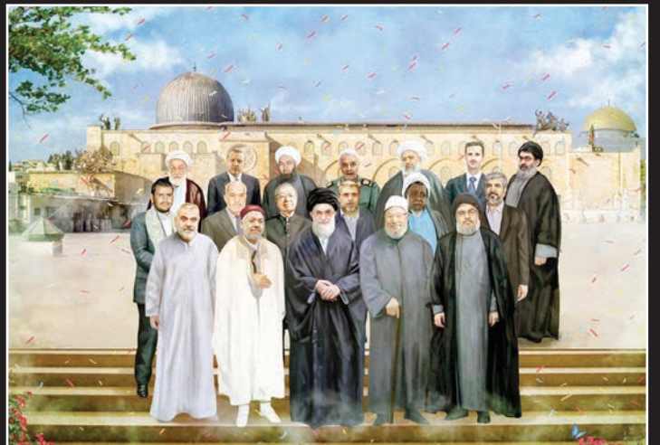
همزمان با ابراهیمایی آخرین ماهه مراسم جشن عکاسان سینما تجلیل می‌شوند. هنری شهرزاد در فر هنگسرای اقدس رونمایی شد.

شهرزاد که فصل اول را با موفقیتی بی‌سابقه و چشمگیر به پایان رساند؛ از همان نخستین روزهای تولید فصل دوم با حاشیه‌های ریز و درشت پرشمار دست‌وپنجه نرم کرد تا حدی که در واقع می‌شود گفت؛ آغاز تولید فصل جدید این سریال با حواشی ریز و درشت مالی پیوند خورد. این نکته که تصویربرداری فصل دوم شهرزاد در حالی آغاز شد که تهیه‌کننده و سرمایه‌گذار سریال در بازداشت به سر می‌برد و سرمایه‌گذار دوم نیز در رسانه‌ها اعلام کرده بود؛ سریال بدون اجازه او کلید خورده و حتی سعی در متوقف کردن آن داشت؛ می‌تواند به بهترین وجهی شدت و میزان حاشیه‌هایی که شهرزادی‌ها در این برهه زمانی از سر گذرانده‌اند، روشن کند، اما شهرزاد ۲ در چنان شرایطی جلوی دوربین رفت. اتفاقی که بهترین بهانه برای نشریات و رسانه‌های کاغذی و مجازی پرشمار - و شاید هم حاشیه‌ساز و حاشیه‌باز بود که می‌پر سینند، در حالی که سرمایه‌گذار دیگری پرونده بزرگ مالی شده و در زندان به سر می‌برد، سرمایه‌گذار آغا‌فاز جدید این سریال از کجابه دست آمده است؟