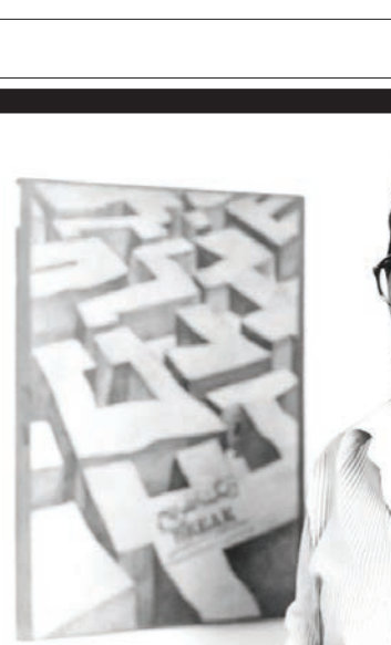
کمپانی‌اکتیر گروه معتبرترین سازمان در بخش نسخه نمایش خانگی محصولات کلاسیک سینما است در تریکی مطلق همچنان هست و به کمک شمایی آید.

شهرزاد که فصل اول را با موفقیتی بی‌سابقه و چشمگیر به پایان رساند؛ از همان نخستین روزهای تولید فصل دوم با حاشیه‌های ریز و درشت پرشمار دست‌وپنجه نرم کرد تا حدی که در واقع می‌شود گفت؛ آغاز تولید فصل جدید این سریال با حواشی ریز و درشت مالی پیوند خورد. این نکته که تصویربرداری فصل دوم شهرزاد در حالی آغاز شد که تهیه‌کننده و سرمایه‌گذار سریال در بازداشت به سر می‌برد و سرمایه‌گذار دوم نیز در رسانه‌ها اعلام کرده بود؛ سریال بدون اجازه او کلید خورده و حتی سعی در متوقف کردن آن داشت؛ می‌تواند به بهترین وجهی شدت و میزان حاشیه‌هایی که شهرزادی‌ها در این برهه زمانی از سر گذرانده‌اند، روشن کند، اما شهرزاد ۲ در چنان شرایطی جلوی دوربین رفت. اتفاقی که بهترین بهانه برای نشریات و رسانه‌های کاغذی و مجازی پرشمار - و شاید هم حاشیه‌ساز و حاشیه‌باز بود که می‌پر سینند، در حالی که سرمایه‌گذار دیگری پرونده بزرگ مالی شده و در زندان به سر می‌برد، سرمایه‌گذار آغا‌فاز جدید این سریال از کجابه دست آمده است؟