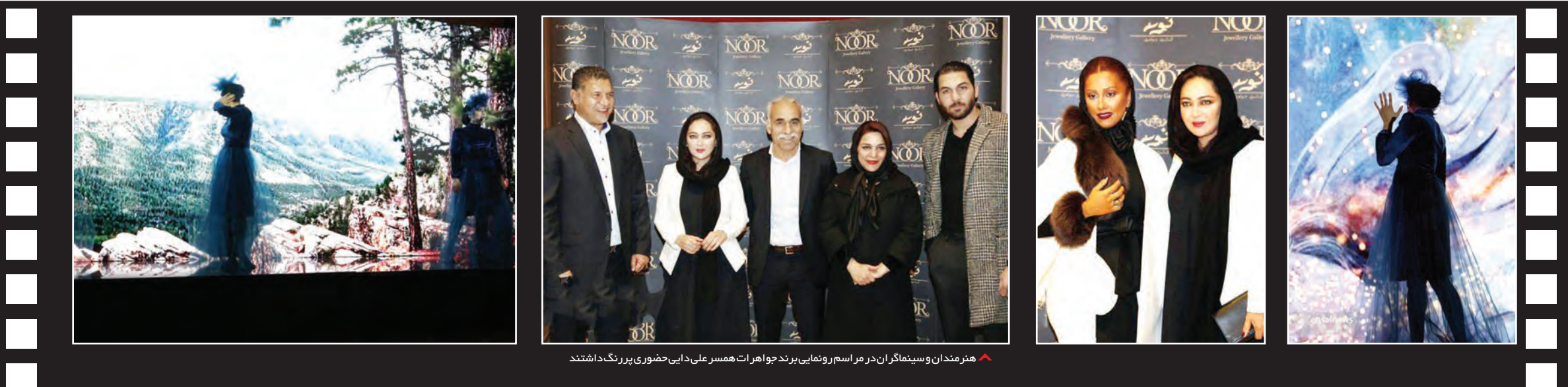
هنرمندان و سینماگران در مراسم رونمایی برنده جوهرات همسر علی‌دایی حضوری پررنگ داشتند