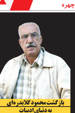
یاز گشت محمود گلایدرهای به دنیای ادبیات

شهروند! محمدحسین مهدویان که در دو سال اخیر با فیلم‌های ایستاده در غبار و ماجرای نیمروز حضوری موفق در جشنواره فجر داشته، به احتمال زیاد امسال با دو فیلم در جشنواره فجر حضور خواهد داشت. این کارگردان که در حال کار بر روی لاتاری پرسروصدایش است که به نظر می‌رسد جزو کنجکاوبر انگیز ترین فیلم‌های جشنواره امسال باشد، بنا به اعلام هیأت انتخاب فیلم‌های مستند جشنواره فجر با فیلم مستند ترور سرچشمه نیز می‌تواند در جشنواره حضور یابد. این فیلم یکی از یازده فیلمی است که توسط هیأت انتخاب جشنواره، به عنوان مستندهای منتخب معرفی شدند. تا در نهایت از بین این یازده مستند دو اثر به بخش مسابقه راه یابند؛ یعنی اگر ترور سرچشمه انتخاب شود و لاتاری هم به جشنواره برسد، مهدویان با دو اثر در جشنواره خواهد بود. اما مستندهای دیگر محمد آفریده، حبیب احمدزاده و فرهاد مهران فر اعلام کردند که آبی به رنگ آسمان ساخته امیر ربیعی؛ بانو قدس ایران ساخته مصطفی رزاق کریمی؛ در جستجوی فریده به کارگردانی آزاده موسوی؛ در گرداب انقراضی فتح‌الله امیری؛ رزم آرا، یک دوسیه مسکوت ساخته سپیداحسان عمادی؛ زبانی با گوشواره‌های باروتی به کارگردانی رضا فرهمند؛ فریاد رو به باد ساخته عطا مهراد؛ ملوانان تنها به در نمی‌روند به کارگردانی الله کرم رضایی؛ زاد؛ موج نسو احمد طالبی؛ زاد و وه انبویک شاپور به کارگردانی سودابه مجاوری؛ فیلم دیگری هستند که در کنار فیلم ترور سرچشمه برای ورود به بخش مسابقه جشنواره امسال با هم رقابت خواهند داشت. گفتنی است در آخرین ساعات روز گذشته دبیرخانه جشنواره از حذف فیلم موج نوی احمد طالبی؛ زاد به دلیل مغایرت با آیین نامه از بین فیلم‌های منتخب خبر داد.