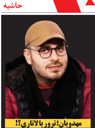
مهدویان؛ ترور یا لاتاری؟! حاشیه