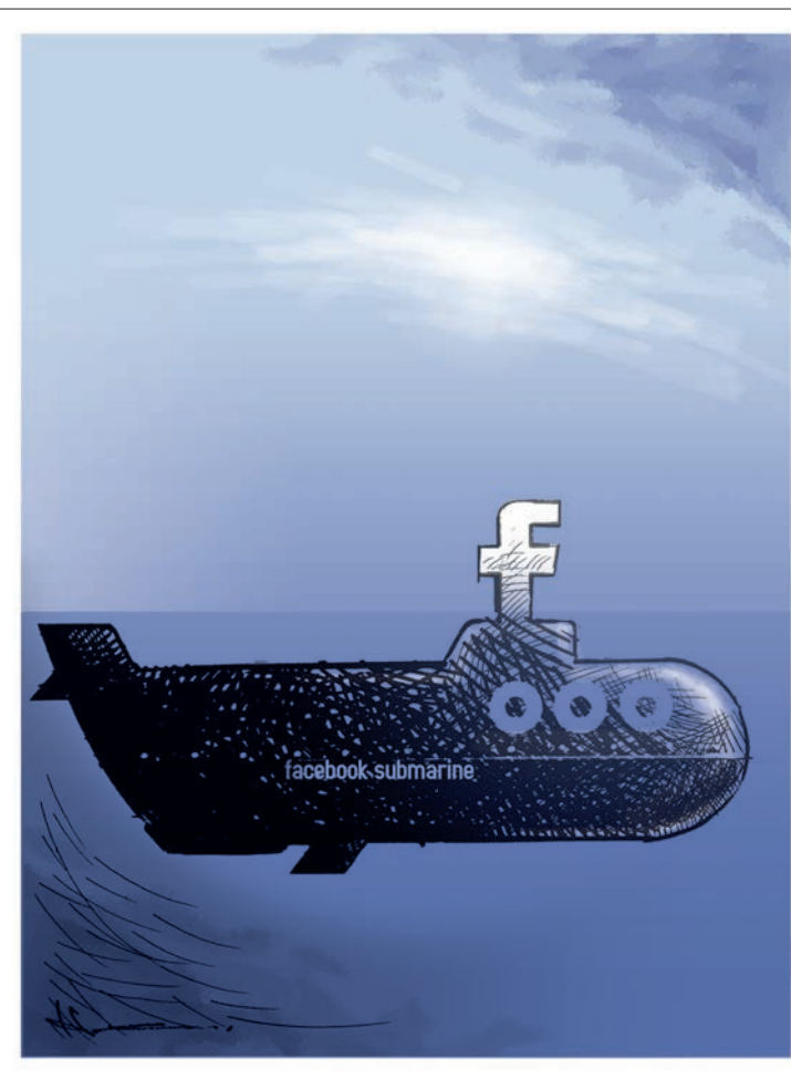
طرح: حسین کریمزاده