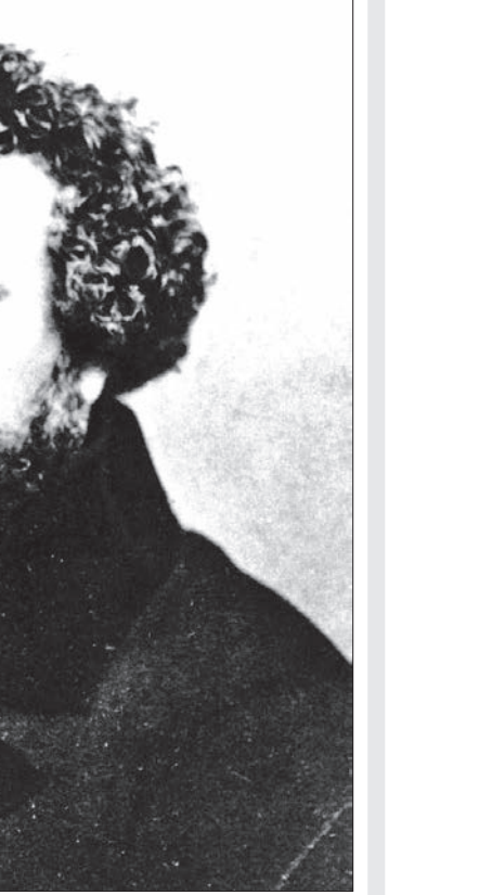
ساموئل کلت، مخترع اسلحه‌سازی کلت بوده و مخترع سلاح زلور بود.

۱۵۵ سال پیش، برابری با دهم ژانویه ۱۸۶۲ میلادی، ساموئل کلت، مستنکر و مخترع آمریکایی در هارتفورد کانکتیکت