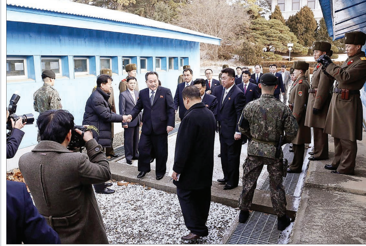
مقام‌های کره شمالی و کره جنوبی، صبح روز سمشنبه ۹ ژانویه، برای نخستین بار طی ۲۰ سال گذشته در منطقه غیر نظامی حایل بین دو کره دیدار کردند.