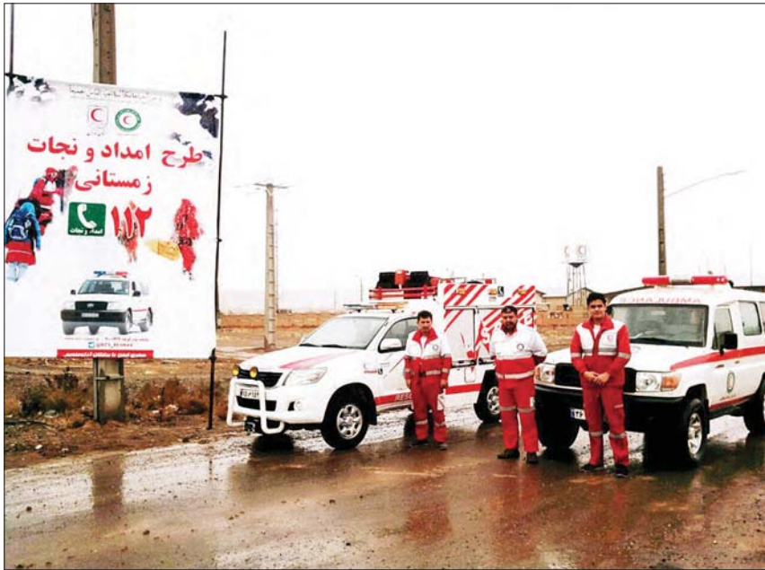
▲ طرح ملی امداد و نجات زمستانی، استقرار تیرهای عملیاتی محور اتوبان تهران - قم و تهران - شهرری، پایگاه امداد و نجات جاده‌های حسن آباد

شهرزند اداوطلب‌اند؛ مز دشان هم می‌تواند یک‌لیخند باشد یا یک‌خداخیرت بدهد. به این چندعکس نگاه کنید؛ همه جا هستند هر جا که ضرورت حضورشان احساس شود، راستش این خاصیت فعالیت داوطلبی است. در کارشان بار اداه‌اند، زمستان و تابستان هم ندارد، هر زمانی برای نجات آمادها‌ند، در کوهستان آمادها‌ند و در دریا نجات غریق. در صعب‌العبورترین مسیرها برای نجات جات آدم‌ها حاضر می‌شوند و از جان مایه می‌گذارند. این صفحه روایت همین آدم‌ها است؛ آدم‌هایی که بی‌قرار داوطلبی‌اند. این چند تصویر تنها گوشه‌ای از خدمات و فعالیت‌های داوطلبانه‌امدادگران جمعیت هلال احمر است در هفته‌ای که گذشته است؛ اسم صفحه را هم گذاشتیم، «قاب داوطلبی». قابی که تنها توان نمایش بخشی از خدمات داوطلبانه را داره؛ نگاهشان کنید!