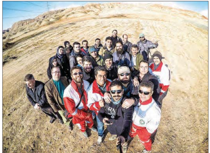
▲ سملی، بازدید اهالی سنده از مرکز آموزش و نگهداری سگ‌های نوجوه آموزش و کار این مرکز در مواقع بحرانی، مرکز آموزش و نگهداری سگ‌های زخمی‌سازمان امداد و نجات