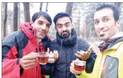
▲ سملی، تیم کوهستان در هوای برفی و سرد، گرمان، پایگاه کوهستان صاحب