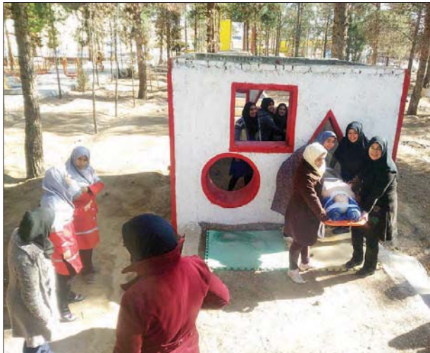
▲ دورمرکتبلی نجات خواران، اسفهان، نجات آباد، مرکز تخصصی امداد و نجات شهرستان نجف آباد