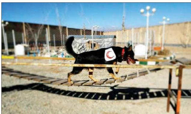
▲ عبور از موانع، مرکز آموزش و نگهداری سگ‌های زخمی‌سازمان امداد و نجات