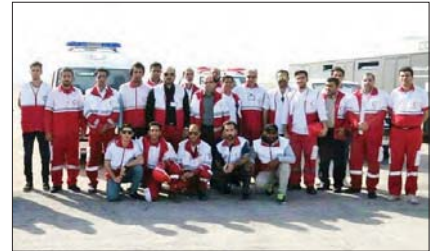
▲ مرکز آری‌ماور سلامت سفر (سوقه هونایتا)، هلال احمر گیش، پایگاه‌های فرودگاه و دیگه‌های المللی و ساحلی امام حسین (ع)