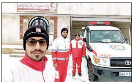
▲ سملی، آمادگی کامل تجهیزات و نیروهای امدادی در هوای برفی، پایگاه شهید غزنوی، اسفهان - گیانگان