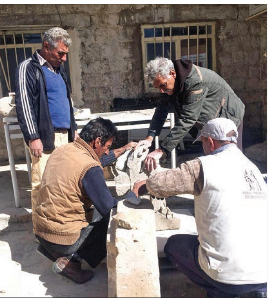
● هیأت مرمت تخت جمشید در حال بازسازی قطعات شکسته شده در ایذه

● دلیل استعفاتان چه بود؟ تمام اتفاقات اداره میراث فرهنگی در شهر ایذه و ضعف نیرو، کمبود امکانات لجستیکی و مالی، من هم زمان مسئول پایگاه پژوهشی آیاپیر هم هستم و