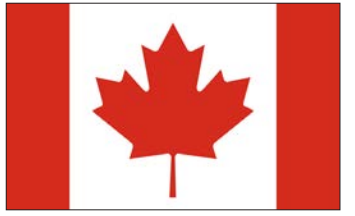
زنان کانادایی پیشرو در خوداشتغالی

جالب است بدینم زن مجارستان ۴۳ درصد از افرادی هستند که تحصیلات تکمیلی مدیریتی را در این کشور با موفقیت به پایان می رسانند و جالب تر این که ۴۰ درصد از بست های مدیریتی در این کشور به سهم زنان اختصاص داده شده است.