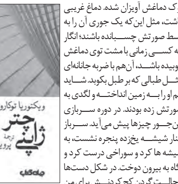
انتشارات جهان کتاب منتشروروی پیشخوان کتابفروشی‌ها قرار گرفته‌است.

نوک دماغش اویزان شده. دماغ غریبی داشت، مثل این که یک جوری آن را به وسط صورتش چسباندند؛ انگار که کسی زمینی نداشت و دماغش کوبیده باشد، آن هم با ضربه جانانه‌ای مثل طبلایی که بر طبل بکوبد، شاید هم او را به زمین انداخته و لگدی به صورتش زده بودند. در دوره سربازی این جور چیزها پیش می‌آید. سرباز کنار شیشه بیخ‌زده بنجره نشست، به شیشه‌ها کرد و سوراخی درست کرد و نگاه به بیرون دوخت. در شکل دست‌ها و حالت گردن کج کردنش برای من چیز غیرقابل‌توصیفی بود. سعی کردم که این چیز را برای خودم مشخص کنم و ناگهان برآم روشن شد: بوزاکاکار پوف!