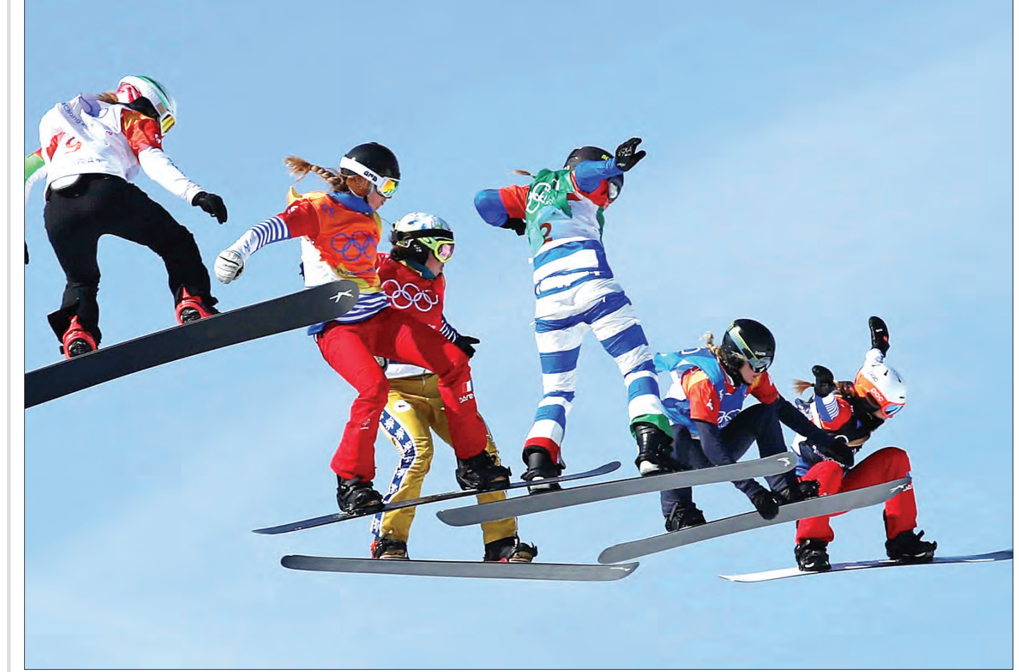
دیروز جمعه، مسابقات المپیک زمستانی پیونگ چانگ هفتمین روز خود را پشت سر گذاشت. به نظر می‌رسد عکاسان ورزشی حاضر در کره جنوبی کمیود سوژه‌ها داشته باشند؛ درست مثل شکار این لحظه از مسابقات اسنوبرد زنان که در کسری از ثانیه ۶ نفر از شرکت‌کنندگان با هم در آسمان شاور شده‌اند.