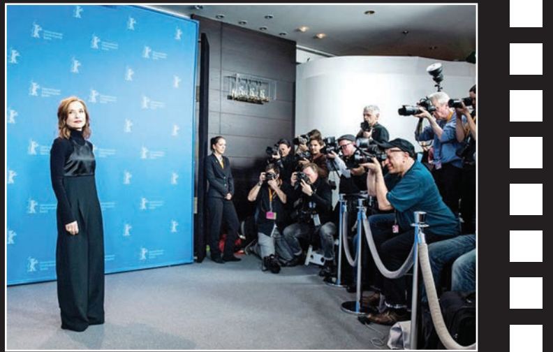
در ششمین و هشتمین دوره جشنواره فیلم برلین تاکنون سینماگران مشهوری از کشورهای مختلف از جمله ایل یوزر برای نمایش آثار جدیدشان در کاخ جشنواره حاضر شده‌اند.