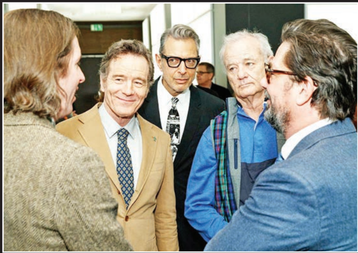
صدابینسگان سرشناس انیمیشن جزیره سگ‌ها جدیدترین ساخته‌وس اندرسون در برلیناله