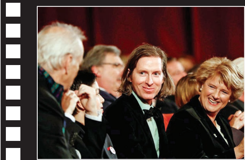
وس اندرسون با انیمیشن جزیره سگ‌ها در جشنواره برلین حاضر است