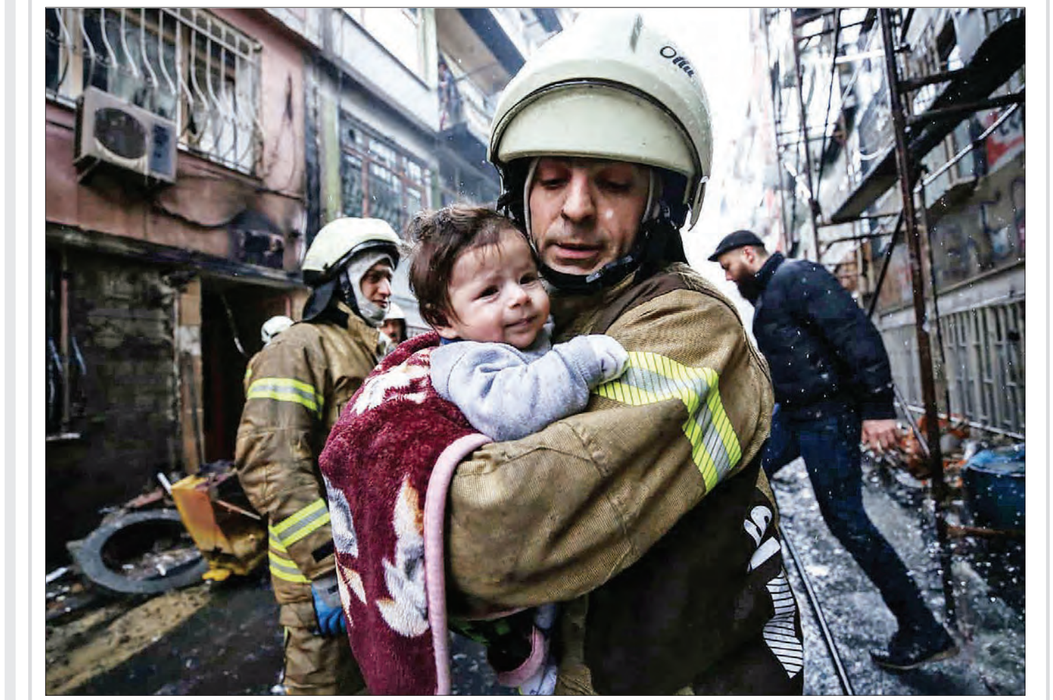
نجات یک کودک از حادثه انفجار گاز در محله فتح استانبول.