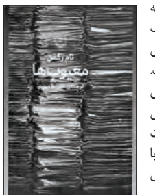
کتاب «معیوب‌ها» اثر تسم رومن

رمان ستایش شده تمام زکمن، برای نخستین بار سال ۲۰۱۰ منتشر شد و طولی نکشید تا به بیش از ۲۰ زبان ترجمه و چاپ شود. رومن نویسنده‌ای است انگلیسی‌الصل، بزرگ شده کانادا و ساکن لندن. یک روزنامه‌نگار مشهور و شناخته‌شده که در خبرگزاری آسوشیتدپرس کار می‌کند و در مقام رمان‌نویس نیز به جایگاه مهمی دست یافته است. او در دانشگاه سینما خواننده و بعدتر فوق لیسانس خود را در رشته روزنامه‌نگاری گرفته است. رمان «معیوب‌ها» از دل همین زندگی روزنامه‌نگاری بیرون آمد. قصه چند آدم در تکه‌های گوناگون جهان که قرار است کنار هم روزنامه‌ای در بیابند توی می. قصه هر کدام از این مردان و زنان ملو از فرار و فرودهایی است که به هم پیوندشان می‌دهد یا از هم دورشان می‌کند و گاهی حتی به انتقام‌طلبی تحقیر کننده و می‌داردشان. رمان ریتمی تند دارد و پُر از اتفاقی و ماجراست، نفس گیر و غیر قابل پیش‌بینی پیش می‌رود و با رمانی رئالیستی روبه‌رویم که در آن قصه «فساد» و «خبر» در هم تنیده شده است. نام رومن رمانی بی‌پروا نوشته که در آن ظهور و سقوط آدم‌ها را در یک روند کوتاه زمانی نشان می‌دهد و روایت می‌کند که چطور یکی می‌کوشد دیگری را تحت سلطه خود در آورد. نام رومن سال ۱۹۷۴ در لندن به دنیا آمد و در ونکوور