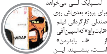
اسپایک لی می‌خواهد برای پروژه بعدی‌اش روی صندلی کارگردانی فیلم «تایت‌تاج» که اسپین آف از «اسپایدرمن» است، بنشیند. این فیلم در کنار دیگر متعلقات کمپانی مارول کمیکس مثل «نونوم»، «قره و مشکی» و «موربوس خون‌آشام زنده» در دنیای «اسپایدرمن» کمپانی سونی جای خواهد گرفت. مسئولیت فیلمنامه‌نویسی آن را چوهداری کوکر برعهده دارد که در حال حاضر شورتل سربال «لوک کیج» مارول است.