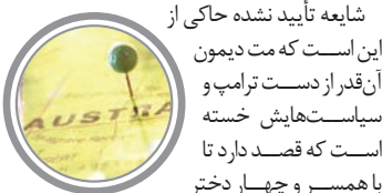
شایعه تأیید نشده حاکی از این است که مت دیمن آن قدر از دست ترامپ و سیاست‌های خسته است که قصد دارد تا با همسر و چهار دختر کم‌سنش به آن سر دنیا برود و در استرالیا سکونت کند. در واقع از آن‌جا که دیمن به تازگی خانه‌ای در منطقه بروکن هلد استرالیا خریده است، این شایعه تقویت شده است. این منطقه ۵۰۰ مایل با ساحل سیدنی فاصله دارد.

جرج لوکاس سازنده «جنگ ستارگان» کلنگ ساخت موزه یک‌میلیارد دلاری‌اش را به زمین زد. لوکاس با همکاری می یانسونگ آرشیستک چنی طرحی فضایی و برقی را که یادآور فضای زندگی آینده باشد، در نظر گرفته که به نوعی شبیه فضاهای موجود در «جنگ ستارگان» نیز هست. نقطه تمرکز این موزه حدود ۳۰ هزار اثر شامل استوری برد، لباس‌ها، نوشته‌ها و... مربوط به «جادوگر شهر آژ»، «کازابلانکا» و البته طبیعتاً مجموعه «جنگ ستارگان» است.