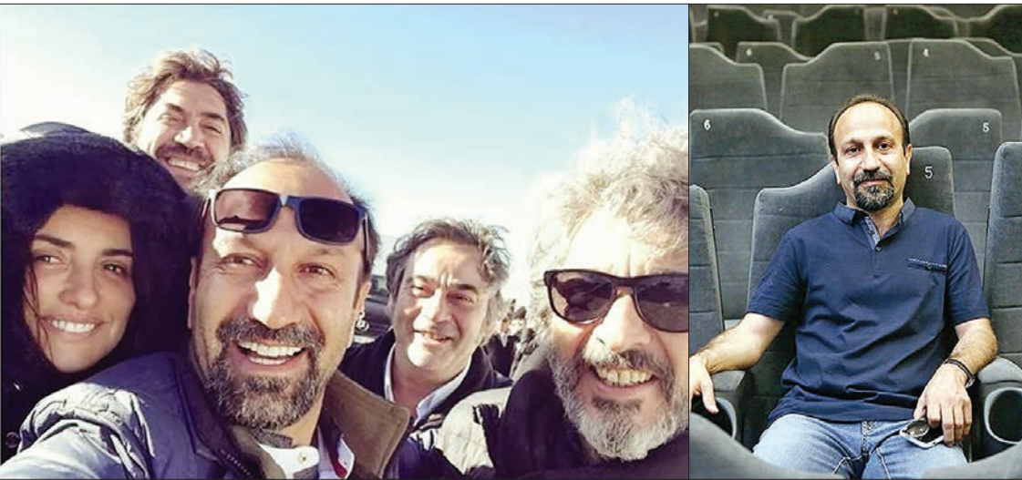
امین فرج‌پور - شهروند | روز گذشته نشریه سینمایی معتبر اسکرین دیلی خبری منتشر کرد که شاید بیش از کشور محل انتشار نشریه، این خبر در ایران سر و صدا کند. خبری که حکایت از این داشت که به احتمال فراوان فیلم تازه اصغر فرهادی به عنوان یکی از گزینه‌های اصلی حضور در جشنواره فیلم کن در این فستیوال معتبر و معظم جهانی رونمایی خواهد شد.

روز گذشته رسانه‌ها خبر از رونمایی فیلم جدید اصغر فرهادی در فستیوال کن دادند اما آیا این فیلم به عنوان یک فیلم ایرانی به کن خواهد رفت یا یک فیلم اسپانیایی؟