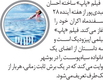
فیلم «پاپ» ساخته احسان عدیدی پور از هفته آینده ۲۸ اسفندماه اکران خود را آغاز می‌کند. فیلم «پاپ» فیلمی اپیزودیک است و سه داستان از اعضای یک خانواده سیاه‌پوست را در بوشهر روایت می‌کند که در یک برش ثابت زمانی، هربار از یک طرف تعریف می‌شود.

محصولات فرهنگی جانی نیمیش-سینمایی «فیلشاه» ازجمله کتاب قصه و رنگ‌آمیزی این انیمیشن همزمان با اکران این فیلم برای توزیع در سینماهای نمایش دهنده تولید شده و از روز شنبه ۲۶ اسفند توسط موسسه بهمن سبز عرضه و به فروش می‌رسد. محتوای این کتاب، قصه‌ای براساس شخصیت‌های قصه «فیلشاه» است که امکان رنگ‌آمیزی نیز برای خردسالان و کودکان وجود دارد. علاوه بر اینها، پرچسب شخصیت‌ها را نیز به‌عنوان هدیه به این مجموعه اضافه کرده‌ایم.