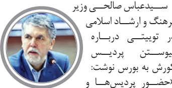
سیدعباس صالحی وزیر فرهنگ و ارشاد اسلامی در توییتی درباره پیوستن پردیس کورش به بورس نوشت: «حضور پردیس ها و فیلم‌های سینمایی در بورس، فرصت‌سازي جديد براي اقتصاد هنر است. با ورود پردیس کورش و ۵ تا ۱۰ فیلم سینمایی این مسیر آغاز می‌شود.»

نخستین سالن اختصاصی سینمای هنر و تجربه در مجموعه سینمایی فرهنگ تهران از امروز شنبه آغاز به کار می‌کند. با توجه به اتمام مراحل ساخت نخستین سالن اختصاصی سینمای هنر و تجربه با ظرفیت ۶۴ صندلی در مجموعه سینمایی فرهنگ تهران به اطلاع کلیه علاقه‌مندان این سینما می‌رساند از تاریخ ۲۶ اسفند کلیه فیلم‌های هنر و تجربه در این سالن آغاز به نمایش می‌کند.