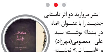
نشر مروریاد در اثر داستانی جدید را با عنوان «سید در بلندا» نوشته سید علی معصومی (مهرزاد) و «اسپایدرمن» نوشته امیرعلی ریحانی را روانه بازار کتاب کرد. «سید در بلندا» نخستین اثر داستانی نویسنده آن به شمار می‌رود که یک داستان اجتماعی را در بستری پرطنش روایت می‌کند. مروریاد این رمان را در ۲۶۸ صفحه با قیمت ۲۴ هزار تومان منتشر کرده است.