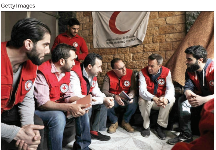
پیترو مانور، رئیس کمیته بین‌المللی ملیپ سرخ، در حال صحبت با کارکنان امدادی در غوطه شرقی سوریه است.