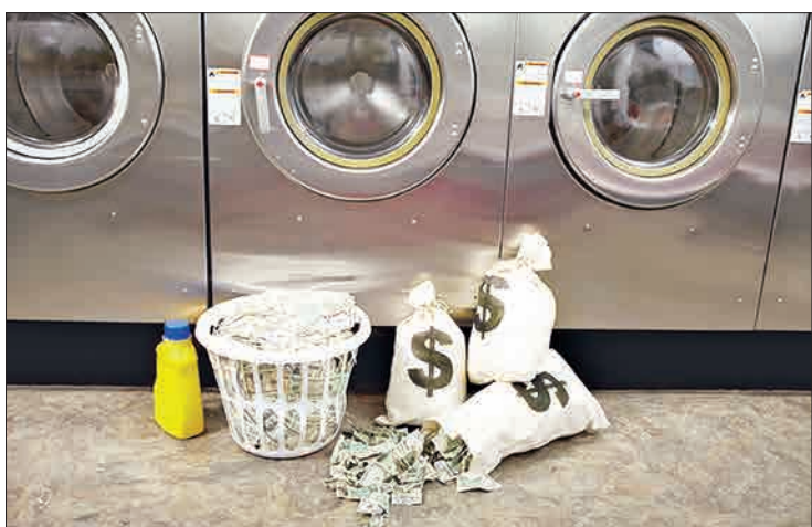
مجلس در ستاد مبارزه با مفاسد اقتصادی هم در پولشویی در کشور اجرامی شدتالتهاب امروز بازار ارز این باره به «شهروند» می گوید: اگر قانون مبارزه با

مجلس کلیات لایحه مبارزه با پولشویی را تصویب کرد