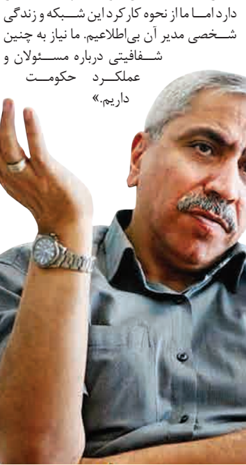
نمک‌دوست، کارشناس علوم ارتباطات