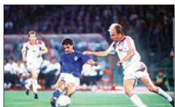
ایتالیا که برای دومین بار میزبانی جام جهانی را بر

انتقام ژرمن‌ها بعد از ۴ سال فینال جام جهانی ۱۹۹۰ دقیقاً تکرار روپاری بودی آرژانتین و آلمان غربی در فینال دوره قبلی این رقابت‌ها بود. آرژانتینی‌ها که در سال ۱۹۸۶ با درخشش دیگو مارادونا توانستند به دومین قهرمانی تاریخ خود دست یابند، رویای دبل کردن در این رقابت‌ها را در سر می‌پروراندند. از سوی دیگر ژرمن‌ها نیز برای گرفتن انتقام شکست دوره قبلی از انگیزه بسیار بالایی برخوردار بودند. آلبی سلسته برخلاف جام جهانی ۱۹۸۶ خیلی بازی‌های چشم‌نوازی از خود نشان نمی‌داد؛ اگر چه همچنان مارادونا در ترکیب خود داشت. فینال این رقابت‌ها به گفته بسیاری از کارشناسان از بدترین و خسته‌کننده‌ترین فینال‌های جام جهانی بود. آرژانتینی‌ها در این مسابقه ۳ بازیکن خارجی داشتند و از آلمان غربی هم یک نفر اخراج شد. در اواسط بازی داوید پئالتی به آلمان غربی اهدا کرد و اندرلیس برمه زنده این پئالتی و تک گل این فینال ملات‌بار شد. آرژانتین نخستین تیمی بود که در فینال جام جهانی موفق به زدن گل نشد و زمین بازی فینال را بدون گل‌زدن ترک کرد و مارادونا کاپیتان افسانه‌ای آرژانتین را به گریه وا داشت.