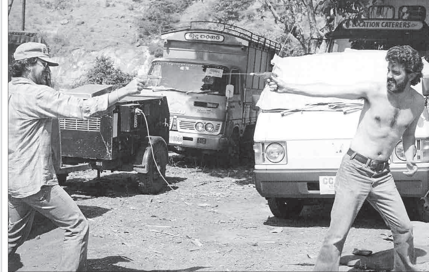
۲۸ بازی جرج لوکاس (راست) و استیون اسپیلبرگ در پشت صحنه فیلم «معبود مرگ» (۱۹۸۴) - از سری ایندیاناجونز

۷۴ سال پیش، برابر با چهاردهم می ۱۹۴۴ میلادی، جرج لوکاس، تهیه‌کننده و کارگردان شهر سینمای آمریکا و یکی از سه ریش‌خو معروف هالیوود - در کنار فرانسیس فورد کاپولا و استیون اسپیلبرگ - در مودستو ایالت کالیفرنیا به دنیا آمد. لوکاس را پیش از هر چیز به خاطر مجموعه «جنگ ستارگان» در جهان می‌شناسند؛ سری فیلم‌های فضایی حماسی که سر منشأ انقلاب تکنولوژیک در صنعت سینما شدند. او همچنین در خلق سری «ایندیاناجونز» در قامت تهیه‌کننده یاریگر دیگر کارگردان نامدار سینمای جهان یعنی استیون اسپیلبرگ بود.