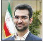
محمد جوان آذری چهرمی:

نیمی از موهای من در اجرای طرح ریجستری گوشی‌های تلفن همراه سفید شده، اما این طرح ۴۰۰ میلیون دلار پرداختی‌های به خزانه کشور را از محل واردات گوشی به کشور در سال افزایش داد. اجرای موفق این طرح در اثر اتصال سه دستگاه گمرک، وزارت صمت و وزارت ارتباطات بود که مجموعاً ۴۰۰ میلیون دلار پرداختی‌های به خزانه کشور را در سال افزایش داد؛ رقمی که حدوداً بیش از هزار و ۶۰۰ میلیارد تومان می‌شود.