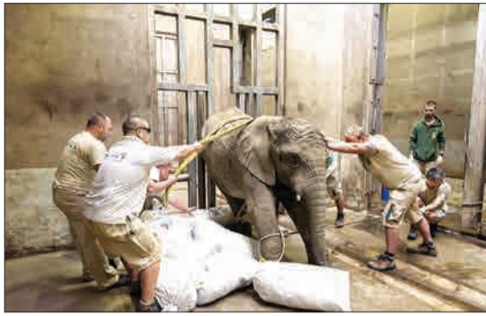
کارکنان یک باغ وحش در مجارستان آماده می‌شوند تا یک فیل بالغ ۳ساله آفریقایی را که از متورم و شکسته شدن عاجش دردمی کشنده درمان کنند.