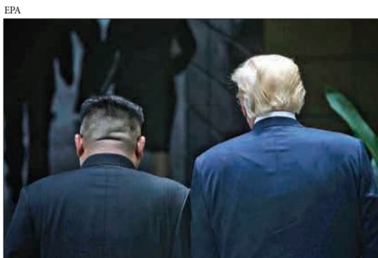
دونالد ترامپ، رئیس‌جمهوری آمریکا و کیم جونگ اون، رهبر کره شمالی، پس از ناهار کاری در زمان دیدارشان با هم در هتل کاپلار در جزیره سنتوسا در سنگاپور قدم می‌زنند.