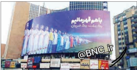
در پی تقدای فراوان به بیلورد میدان ولیعصر تهران، بالاخره بیلورد جدید جایگزین شد. در بیلورد جدید زنان نیز در کنار تیم ملی فوتبال ایران حضور دارند.