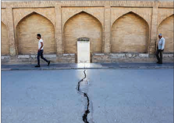
پل‌های تاریخی اصفهان که از بناهای مهم تاریخی ایران و نمادی برای شهر اصفهان محسوب می‌شود، در سال‌های گذشته با مشکلاتی در منظر و مرمت روبرو بوده است.