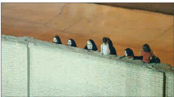
خانم‌ها در اردکان بزد مسابقه فوتبال ساحلی را از پشت دیوار ورزشگاه تماشا کردند.