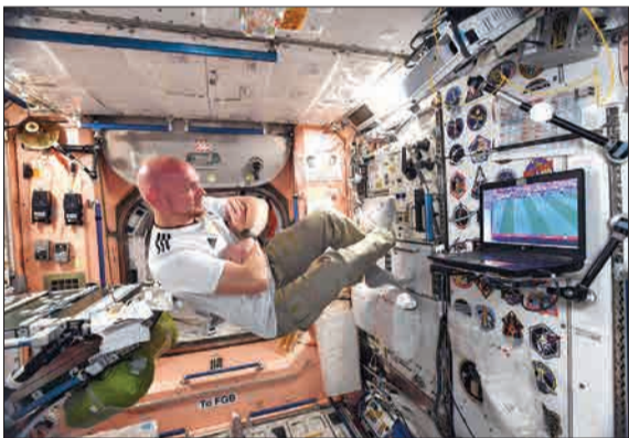
الکساندر گریست، فضانورد آلمانی ایستگاه فضایی اتحادیه اروپا، تماشاگر ویژه بازی آلمان است.