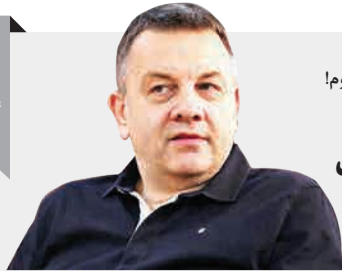
کولاکوویج: از ایران می‌روم! ماجرای قهر سر مربی تیم ملی والیبالی

احمد ضیایی، رئیس فدراسیون والیبالی افشا کرده که کولاکوویج تهدید به جدایی از تیم ملی این رشته کرده است. او درباره تصمیم فدراسیون مبنی بر اعزام تیم ملی به بازی‌های آسیایی جاکارتا گفت: «کولاکوویج با صراحت اعلام کرد اگر قرار باشد ۴ بازیکن تیم ملی را برای بازی‌های آسیایی به تیم «ب» بدهیم باید دنبال سرمربی دیگری برای تیم ملی باشیم. کولاکوویج در حقیقت به نوعی تهدید به ترک تیم ملی کرد و ما مجبور شدیم تیم اصلی را به این مسابقات اعزام کنیم. به دلیل این که سیدعباسی قول مدال طلا را داد، در نهایت تصمیم گرفته شد تا تیم اصلی به این مسابقات اعزام شود.»