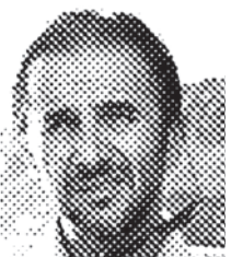
ندارم از کشورم ایران که عاشق مردم و سرزمینش هستم، مهاجرت کنم.

امین حیایی با شمشیر و زره در کارزار نبرد گرین کارت دارم اما عاشق ایرانم