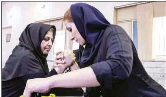
مسابقه حج اندازی بانوان در شهرستان خمینی شهر.