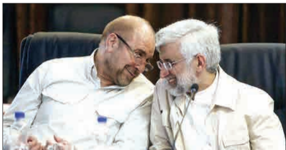
خنده‌های جلیلی و قالیباف در جلسه مجمع تشخیص مصلحت نظام (خبر فوری)