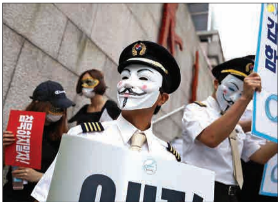
اعتراض خلبان کره‌ای به فساد هیات مدیره هواپیمایی.