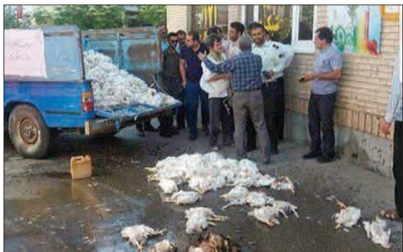
اعتراض مرغداران گناباد مقابل اداره برق؛ قطعی برق مرغ‌ها را اتلاف کرد.

گروهی از جراحان پلاستیک به شهرهای محروم سفر می‌کنند و کسانی را که لب شکری دارند، رایگان عمل می‌کنند. این تصویر در شبکه‌های اجتماعی مختلف باز نشر شده تا نشان بدهد که هنوز هم هستند پزشکی که فقط به ثروت‌اندوزی فکر نمی‌کنند. این گروه تاکنون بیش از ۱۰۰ عمل جراحی فقط در بیرجند انجام داده‌اند. (کاتال شهر مهربان)