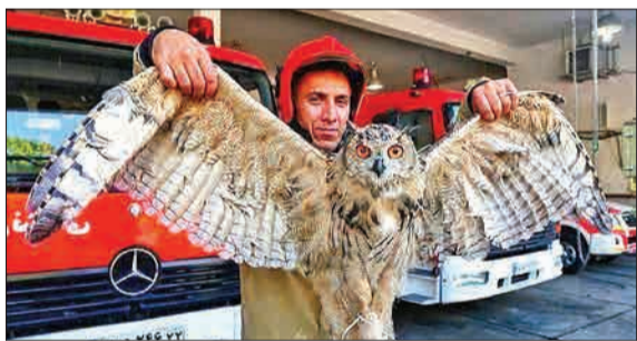
جغد عظیم‌الجثه با ورود به ساختمانی مسکونی در سعادت‌آباد، ترس به جان همه انداخت و در نهایت گرفته شد.

محسن هاشمی در واکنش به انتشار تصویری از تبلت مورد استفاده‌اش که برچسب استفاده دولتی داشت، گفت: «تبلت مذکور در زمان ۴ سال مسئولیت معاونت عمرانی دانشگاه آزاد اسلامی توسط بنده برای کارتابل الکترونیک استفاده می‌شده و پس از استعفا، به دلیل وجود اطلاعات شخصی در آن، به عنوان یک وسیله مستعمل در اختیار بنده باقی مانده و ارزش وقت آن از حساب شخصی من در دانشگاه جهت تسویه محاسبه شده است.» (انتخاب)