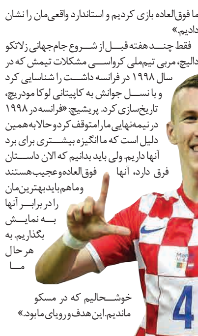
خوشحالیم که در مسکو ماندم. این هدف و رویای ما بود.»

«با این که درام بود اما باز هم نمی توانست غیر ممکن باشد. ما سه بار در این جام از دست رفتیم و دوباره