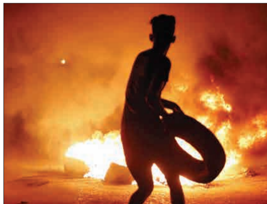
تظاهرات مردم بصره در عراق، در اعتراض به بی‌کاری و هزینه‌های زیاد زندگی.