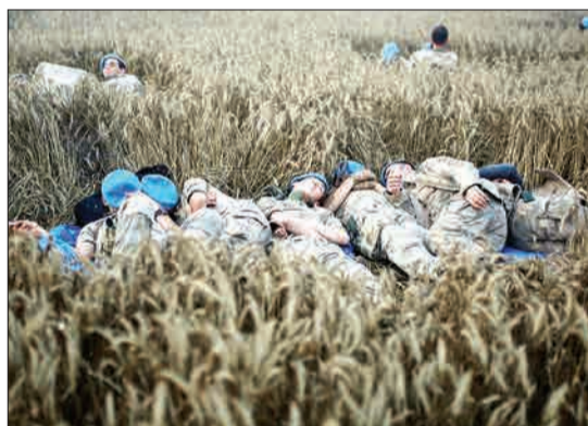
سربازان ترک پس از انجام عملیات نجات در حادثه خارج شدن قطار از ریل، در حال استراحت هستند. روز یکشنبه پس از بارش شدید باران و رانش زمین در شمال غرب ترکیه، این قطار از ریل خارج شد و باعث کشته شدن ۱۰ نفر و مصدوم شدن ۷۳ نفر شد.