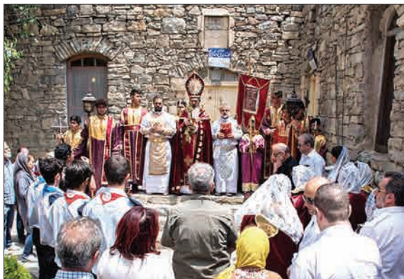
آیین مذهبی سالانه مسیحیان جهان در قرة کلیسای چالدران (ایستا)