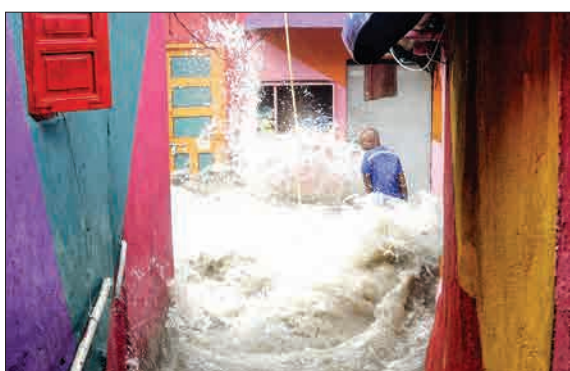
تخریب خانه در اثر سیلاب ناشی از باران‌های موسمی در هند.