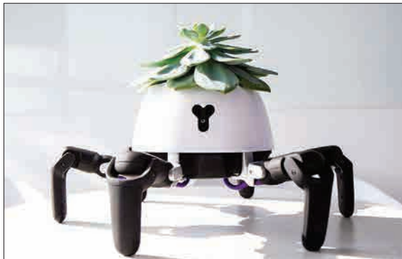
گل داخل ربات ۹۴۹ دلاری خیالتان از هر بابت راحت می‌شود، چرا که نهنها در برابر آفتاب اضافی از گل محافظت می‌شود، بلکه به گفته «تیانکی سان» مدیر کمپانی رباتیک، در صورت فراموشی، آب به مقدار لازم به گل داده می‌شود. (خبر آنلاین)