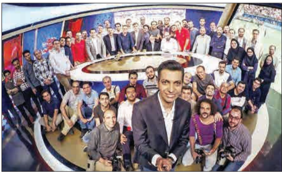
سلفی عادل فردوسی پور با عوامل ویژه برنامه جام جهانی ۲۰۱۸ روسیه در آخرین قسمت این برنامه.