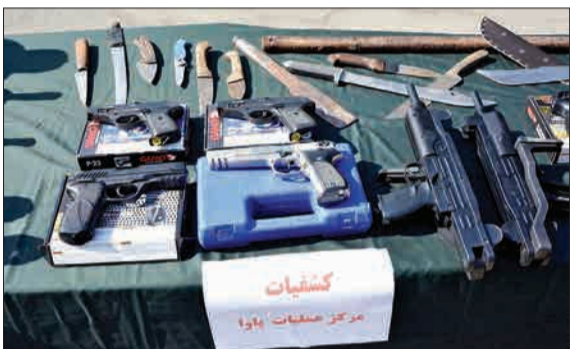
دومین مرحله از طرح سراسری دستگیری ار اذل و اوپاش و مز احمین نوامیس در تهران برگزار شد.