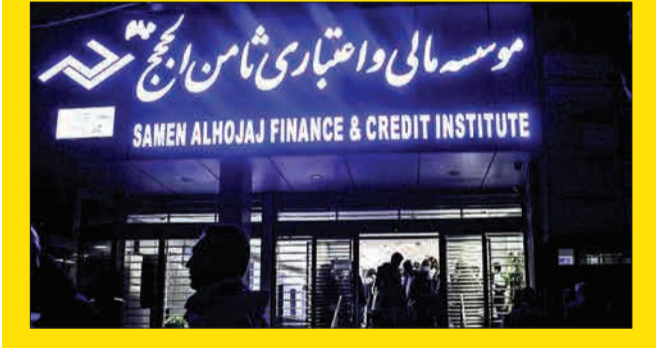
موسسه مالی اعتباری نامن الحجج

در ادامه نماینده حقوقی بانک مرکزی به اقامت خانواده متهم ردیف