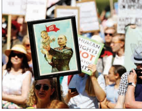
تجمع معترضان فنلاندی در مخالفت با دیدار دونالد ترامپ و ولادیمیر پوتین در هلسینکی فنلاند