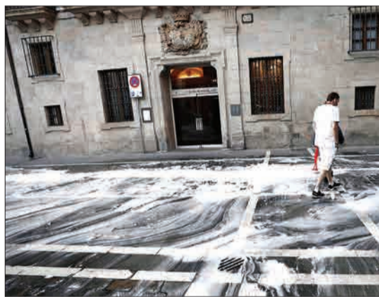
خیابان‌های بامیلونا در اسپانیا پس از پایان فستیوال سن فرمین (کاواری) تمیز می‌شوند.