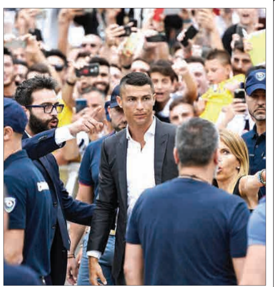
تورین، ایتالیا - کریستیانو رونالدو، بازیکن پر تالان، وارد مرکز پزشکی یونونتوس شده است.