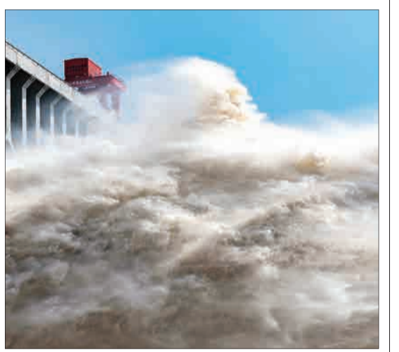
هویی، چین - سد گورجز پس از بارندگی‌های شدید در این کشور بازمی‌شود.