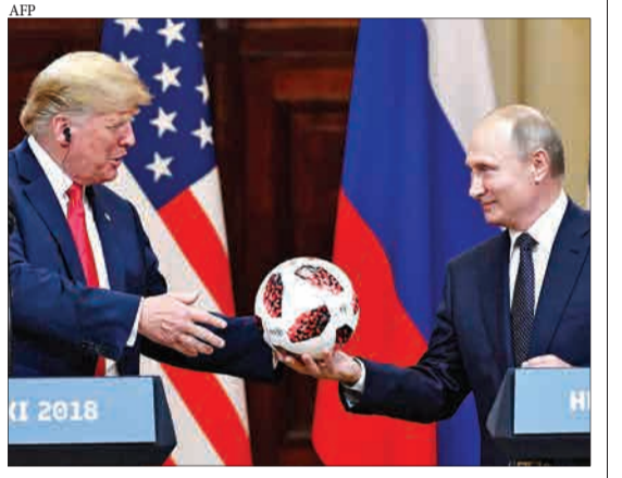
هلستینکی، فنلاند - پوتین یک توپ جام جهانی فیفا را به ترامپ می‌دهد.