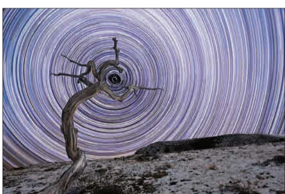
در دهمین سال مسابقه برترین عکاسان نجومی، بیشترین بخت موفقیت را به جیک موشر با عکس «کوهستان راکی» داده اند. این عکس، درخت پیچ خورده در کوه های راکی را نشان می دهد که زیبایی های ستاره قطبی را به رخ کشیده. جیک موشر پس از چندبار آزمون و خطا توانست این عکس را به صورت تایم لپس بگیرد. (خبر آنلاین)