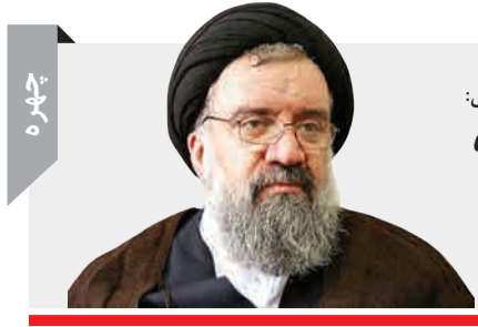
سیداحمد خاتمی: فساد خوره هر نظامی است

در هر اتاقی، محل های امن را مشخص کنید (ملازمین یک میز محکم یا کنار ستونها یا دیوارهای مجاور آنها).