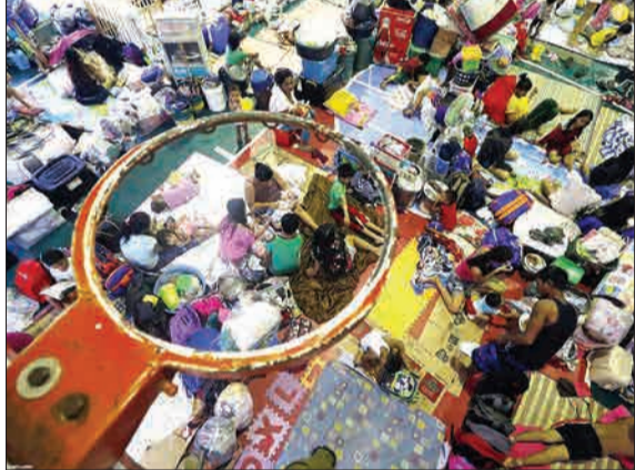
مردم فلیپین برای فرار از سیلاب در یک مدرسه پناه گرفته اند.