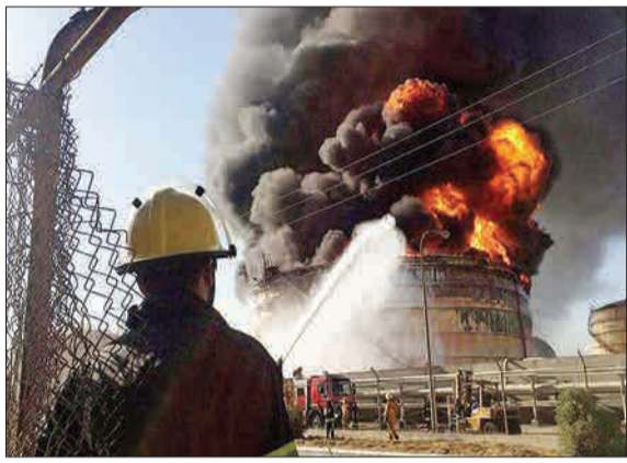
حادثه انفجار در شهر صنعتی خمین دو فوتی و یک مصدوم به جای گذاشت. (ایرنا)