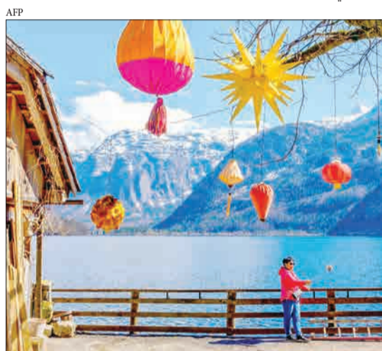
هالشتات، اتریش - یک توریست چینی در دهکده کوچک هالشتات در حال عکس گرفتن است.