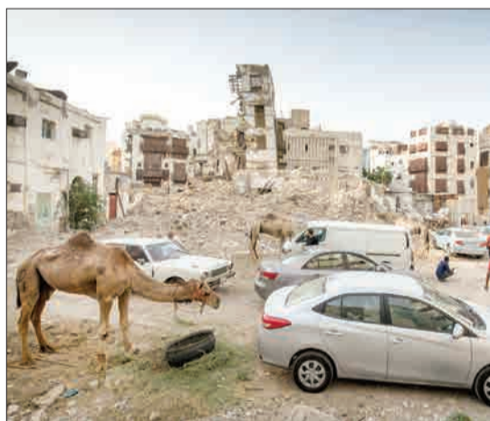
جده، عربستان - شترها و ماشین‌ها در کنار هم حضور دارند.