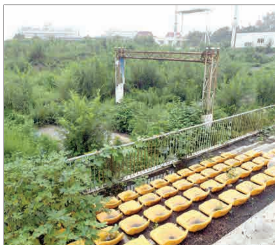
پکن، چین - پیست دوچرخه سواری المپیک ۲۰۰۸ در شهر پکن، دیگر شبیه گذشته نیست.