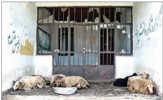
از نشانه‌هایی که مهاجرت از شهر به روستا را با خود دارد، مدرسه‌های نیمه‌مخروبه چهاردانه هستند. این روزها ۱۴ مدرسه در این منطقه در حال ویرانی هستند. در این تصویر، مدرسه پیشین تبدیل به منطقه‌ای برای چرای حیوانات شده است.