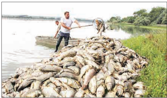
هزاران ماهی در دریاچه‌ای در جمهوری چک به دلیل گرمای کم‌سابقه هوا و کمبود اکسیژن مردند.