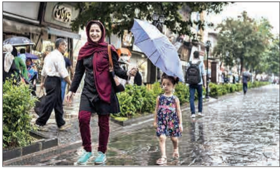
بارش باران تابستانی در رشت.