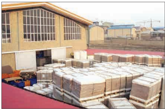
گشت مشترک تعزیرات حکومتی استان تهران در بازرسی از انبارهای منطقه شهری و شورآباد، بیش از ۴۵۰ تن کاغذ و ۹۸ تن نخ که در انبارهایی در شهری احکار شده بود را کشف و ضبط کردند. (سایت چاپ و نشر)