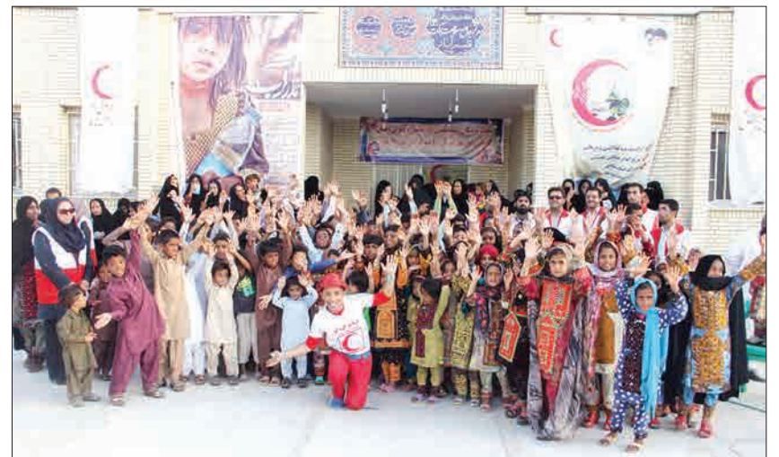
بازدید کاروان سلامت جمعیت هلال احمر اصفهان از روستاهای سیستان و بلوچستان