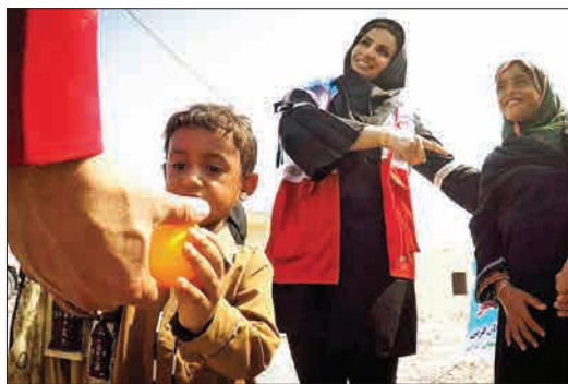
بازدید کاروان سلامت جمعیت هلال احمر آذربایجان غربی از روستاهای سیستان و بلوچستان