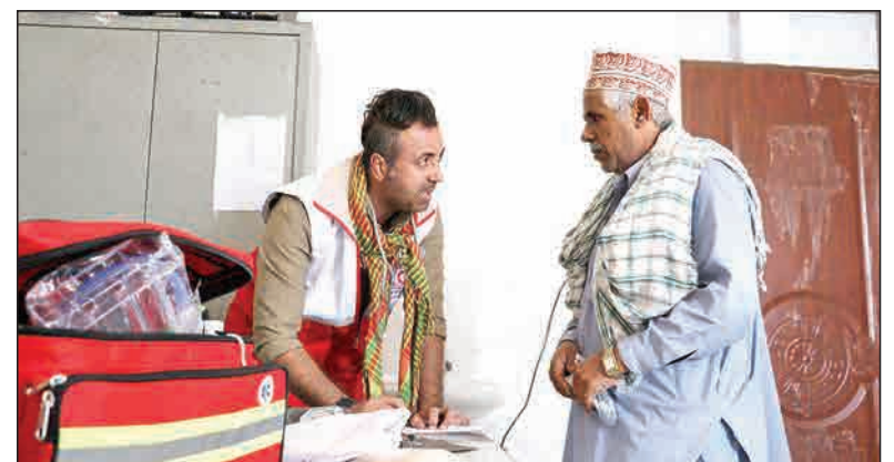
بازدید کاروان سلامت جمعیت هلال احمر خوزستان از روستاهای شهر قصر قند