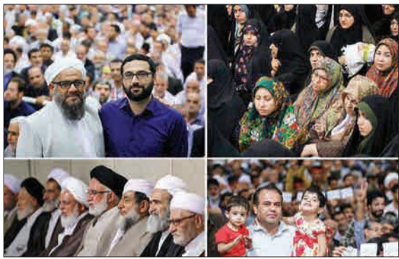
دیدار مردم و علمای اقوام و مذاهب مختلف ایرانی با رهبر انقلاب