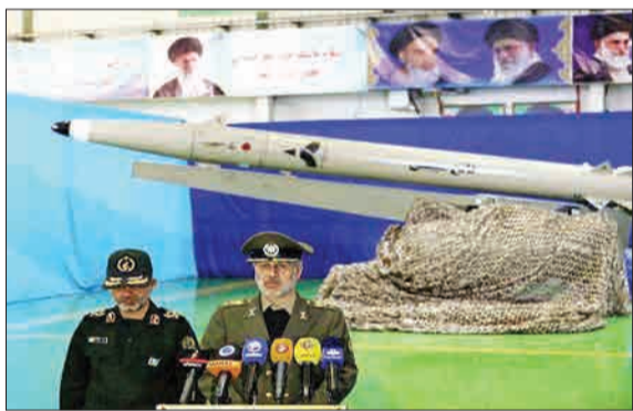
از موشک فاتح مبین، نسل جدید موشک‌های نقطه‌زن زمینی و دریایی با سر جست‌وجوگر پیشرفته و هوشمند با حضور وزیر دفاع و پشتیبانی نیروهای مسلح رونمایی شد.