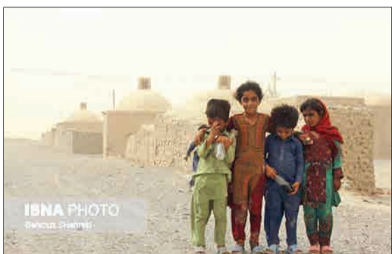
در روزهای گذشته مناطقی از استان سیستان و بلوچستان دچار گرد و خاک و طوفان شده است. غلظت گرد و خاک در مناطق شمالی سیستان و بلوچستان به ۶۰ برابر حد مجاز و سرعت طوفان به ۱۱۹ کیلومتر بر ساعت رسیده است. (عصر ایران)