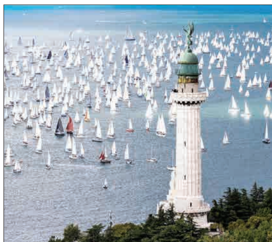
مسابقات قایقرانی در بارسلونای اسپانیا، بزرگترین مسابقات بین‌المللی قایقرانی در جهان است. امسال پنجاهمین سالگرد آغاز این مسابقات است.