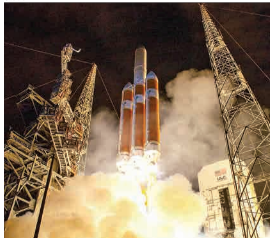
فلوریدا، آمریکا - سازمان فضایی آمریکا، موسوم به ناسا، کاوشگر پارکر را برای تحقیق در مورد خورشید پرتاب کرد.