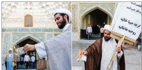
سوز اندن نمادین دلار در حاشیه تجمع اعتراضی طلاب علیه مشکلات اقتصادی - مدرسه فیضیه قم (ایستا)