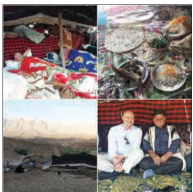
سفیر آلمان در ایران تعطیلات خود را در بین عشایر بختیاری گذراند. (جام جم آنلاین)