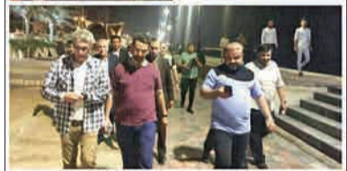
پیداده روی آذری چهارمی وزیر ارتباطات در ساحل پوشهر (انتخاب)