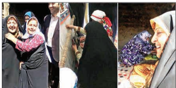
دیدار معصومه ابتکار، معاون رئیس جمهوری با مردم روستای عنبران اردبیل. (چهارمنیوز)