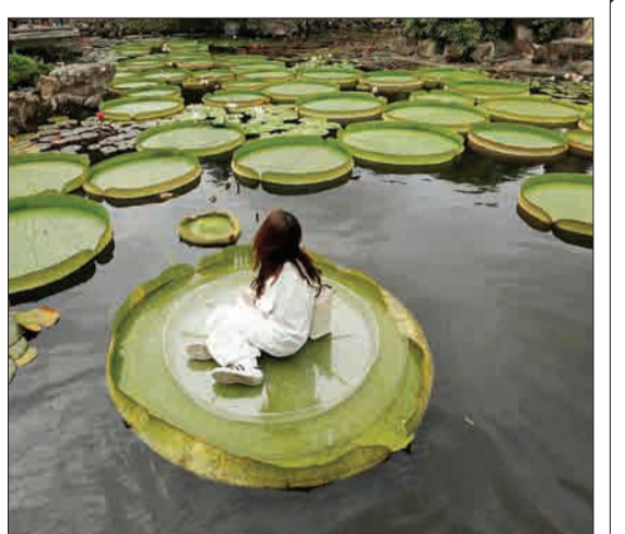
تایپه، تایوان - دختری روی یک برگ بزرگ نیلوفر آبی در پارک شوانگشی نشسته است. این روزها در این پارک نمایشگاه سالانه نیلوفر آبی برگزار می‌شود.