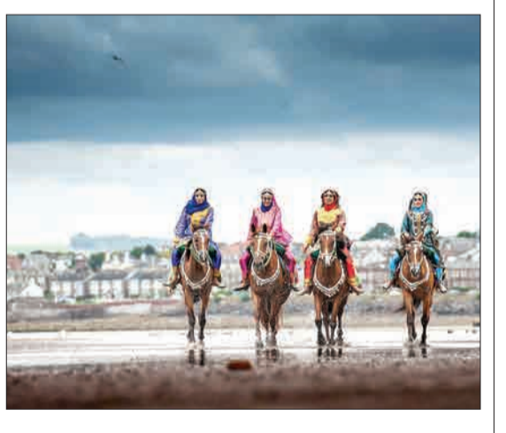
ادینبورگ، اسکاتلند - زنان عمانی که در گروه نظامی کالوری هستند، لباس‌های سنتی عربی بر تن کرده‌اند و با اسب‌هایشان در ساحل تمرین می‌کنند.