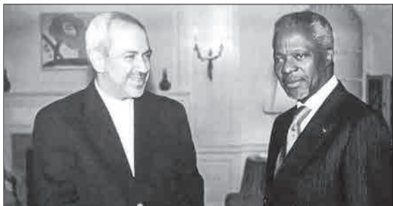
تصویر محمود ظریف، وزیر امور خارجه کشورمان (نماینده وقت ایران در سازمان ملل) در منزل کوفی عنان، دبیرکل وقت سازمان ملل