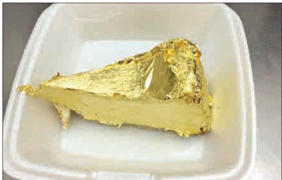
کنال «صرفا جهت اطلاع» با انتشار این عکس نوشته است: «پس از بستنی با روکش طلا، شاهد کیک با روکش طلا هستیم!» اما مشخص نکرده این تصویر متعلق به کجاست و چنین محصولی کجا عرضه شده است؟