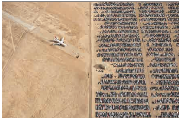
این عکس هوایی از صحرای کالیفرنیا گرفته شده و صف فولکس واگن‌های از رده خارج را نشان می‌دهد که پس از رسوایی شرکت تولیدکننده از سراسر آمریکا جمع‌آوری و به بیابان منتقل شدند تا اسقاط یا نابود شوند. در سال ۲۰۱۵ آژانس حفاظت محیط زیست آمریکا دریافت که شرکت فولکس واگن تست تشخیص دهنده آلاینده‌ها را دستکاری کرده و این در حالی بود که خودروهایش ۴۰ برابر حد مجاز نیتروژن اکسید وارد محیط زیست می‌کرد. (خبر آنلاین)