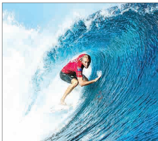
اوون رایت از استرالیا موج سواری است که در مسابقات جهانی موج سواری در سواحل تاهیتی شرکت کرده است.