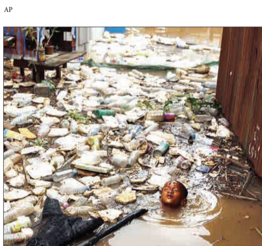
پسر بچه‌ای که در یکی از کانال‌های آلوده شهر پنوم پنه در کامبوج در حال شنا کردن است.