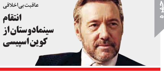
عاقبت بی اخلاقی انتقام سینما دوستان از کوبین اسپسی

حدود ۸۵ درصد از رانندگانی که باعث تصادفات مرتبط با خواب می‌شوند، مرد هستند و حدود یک سوم آنها حداکثر ۳۰ سال سن دارند.