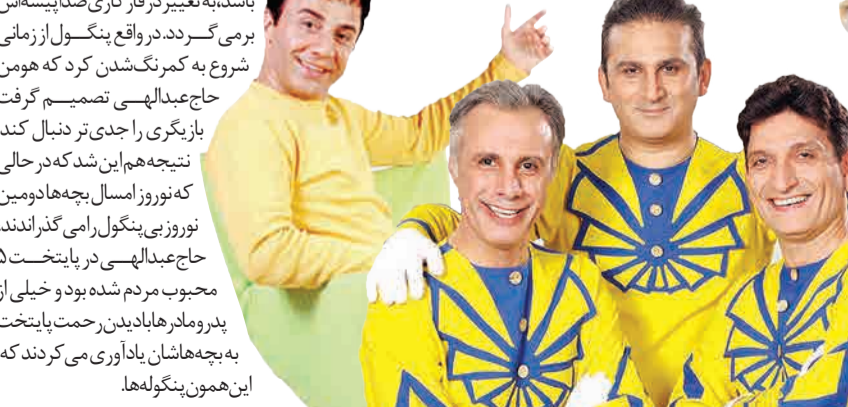
این همون پنگوله‌ها.

دوقلوها که به کارگردانی جمشید بیات‌تر کوتیه‌کنندگی مهدی بصیری با بازی علی فروتن، محمد مسلمی و حمید گلسی که حدود دو دهه است در تلویزیون با عنوان عموهای فیتله‌ای شناخته می‌شوند جلوی دوربین رفته؛ بی‌شک نقطه پایانی