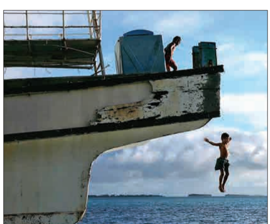
کودکان در شهر فونافوتی در جزیره توالو، در حال بازی و پریدن از روی کشتی از کار افتاده در آب هستند. جزیره توالو در اقیانوس آرام جنوبی در شرق استرالیا واقع است.