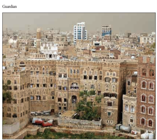
نمایی از بخش قدیمی شهر صنعادر یمن