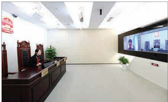
با داشتن بیش از ۸۰۰ میلیون کاربر آنلاین، چینی‌ها دست به خلافت زده و دادگامی را به صورت اینترنتی راه اندازی کرده‌اند. این دادگاه به پرونده‌هایی در حوزه نقل و انتقال مالی، اطلاعات شخصی و مالکیت معنوی آنلاین می‌پردازد و اختلافاتی مانند خرید و فروش آنلاین، فرار اداهای سرویس و خدمات آنلاین، وام، حق ثبت و تکثیر در فضای مجازی را در بر می‌گیرد. (خبر آنلاین)