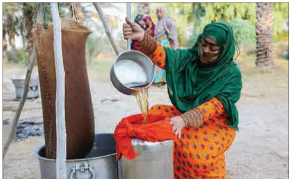
در پایان فصل برداشت خرما، نخلداران خرما می‌مازد خود را بپخته و از آن دوشاب می‌گیرند. دوشاب خرما فرآورده‌ای است که علاوه بر افزودن آن به خرماهایی که شیرین زیادی ندارد، مصارف متعدد دیگری هم دارد؛ مثلاً در شیرینی‌های سنتی یا شربت خرما استفاده می‌شود. (میزان)