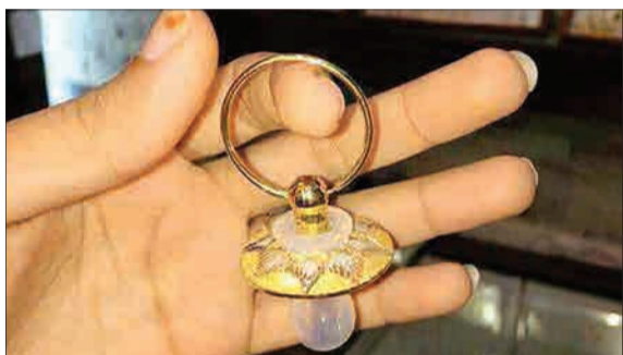
در شرایطی که بازار پوشاک و محصولات بهداشتی ملتهب شده، عده‌ای هم هستند که لاکچری شدن کودکانشان را از بد تولد آغاز کرده‌اند و برای آنها پستونک طلا سفارش می‌دهند! (مشرق نیوز)