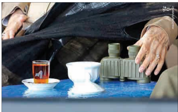
تصویر ویژه پذیرایی ساده از مقام معظم رهبری در حاشیه تمرین دریایی دانشجویان افسری ارتش در ساحل شهر نوشهر و در کنار دریای خزر.