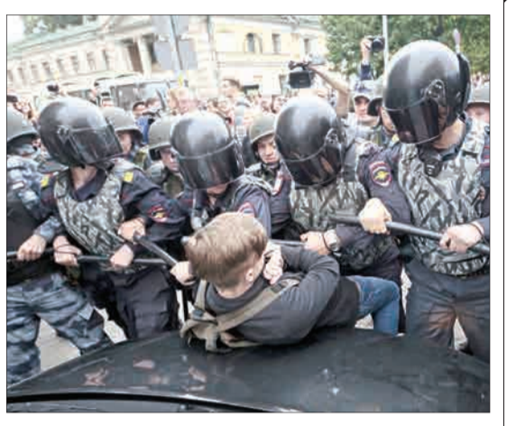
سن پترزبورگ، روسیه - افسران پلیس جوانی را در تظاهرات علیه افزایش سن بازنشستگی بازداشت می‌کنند.