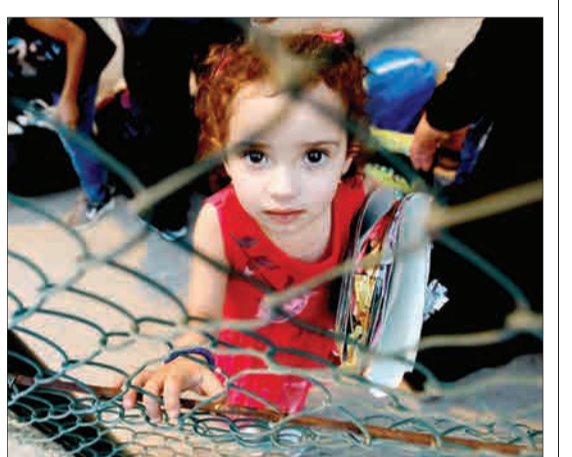
بیروت، لبنان - کودک مهاجری که در انتظار است تا خانواده‌اش برای بازگشت به سوریه آماده شوند. گروهی از مهاجران سوری در لبنان با هماهنگی دولت سوریه و لبنان به سرزمین شان بازمی‌گردند.